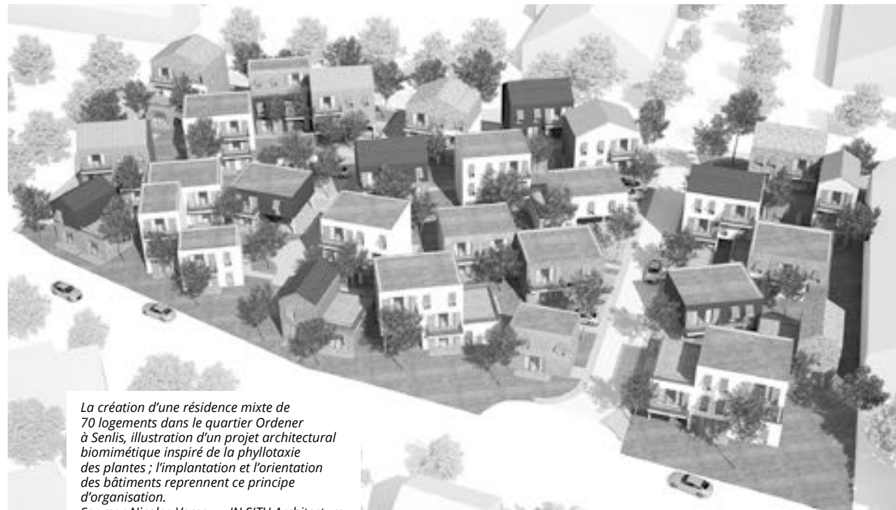
La création d'une résidence mixte de 70 logements dans le quartier Ordener à Senlis, illustration d'un projet architectural biomimétique inspiré de la phyllotaxie des plantes ; l'implantation et l'orientation des bâtiments reprennent ce principe d'organisation.