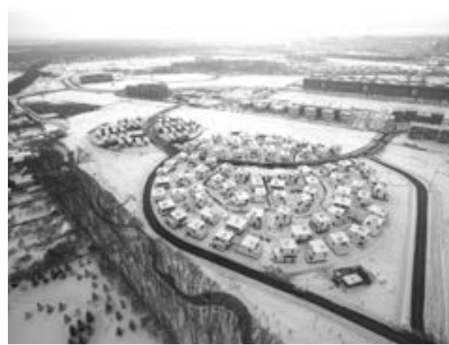
Le District 11, centre d'innovation de Skolkovo en Russie ; à droite, conception du plan de masse. Source : agence Anthony Bechu & Associés.

planète, a aussi une particularité très intéressante : grâce à un phénomène de « super-hydrophobie » engendré par l'extrême rugosité de ses feuilles, il a la capacité de garder celles-ci toujours propres, même dans une eau boueuse. Cet « effet fakir » (les gouttes d'eau « flottent » sur leur support comme le fakir sur son tapis de clous) 7 a été reproduit par la firme Sto dans un enduit en silicone de sa conception, le Lotusan® : la saleté, plutôt que de s'y incruster, s'évacue avec la pluie 8 . L'effet « super-hydrophobe » permet d'envisager un grand nombre d'applications pour permettre à toutes sortes de surfaces (murs peints, vitrages...) de rester sèches et propres.